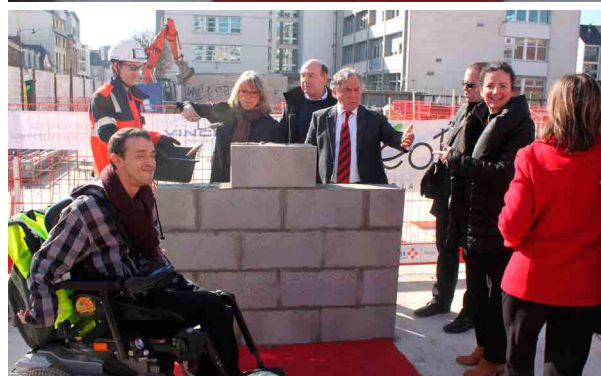
^ Présentation de l'habitat regroupé, janvier 2014