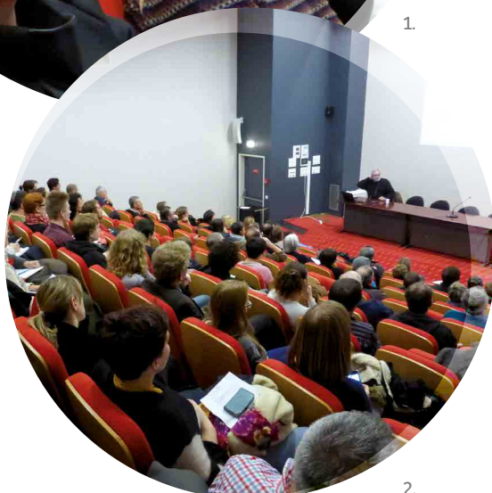
← 1, 2. Conférence au CHU de Rennes, novembre 2014