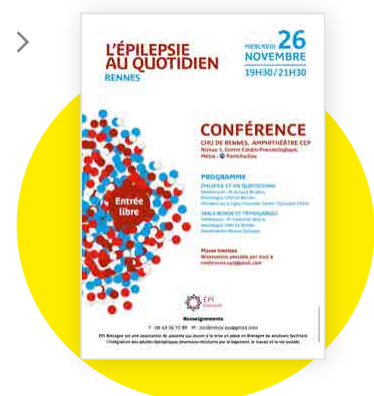
Affiche conférence Rennes, novembre 2014 >

Nous sommes intervenus sur l'épilepsie début février 2014 pour la 7ème Journée Régionale du Réseau Breizh Paralyse Cérébrale lors d'un congrès qui a rassemblé près de 200 personnes, principalement des intervenants en Établissements et Services Médico-Sociaux et des responsables de services publics. Pour l'ensemble de 2014 nous avons organisé huit sessions qui ont touché directement plus de 450 personnes.